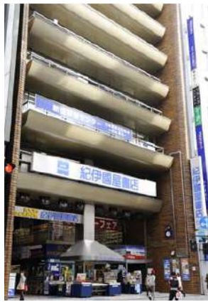
紀伊国屋ビルディング

耐震診断結果の公表は2013年11月に施行された改正耐震改修促進法に基づいています。旧耐震基準で建てられたホテルや商業施設など不特定多数の人が集まる一定規模以上の施設などが調査対象となり、公表されます。都内では852棟が対象となり、3割にあたる251棟が危険性があることがわかりました。