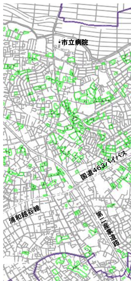
さいたま市緑区には生産緑地が多い(緑色の部分)

ためらう一因となっています。生産緑地の貸借に限り、この法解釈の適用外とします。土地をさらに借りやすくする仕組みも設けます。農地を借りる場合、農業委員会の承認が必要ですが、資産緑地については、市町村の承認を得られれば土地を借りられるようにします。生産緑地は鉱産物の供給だけでなく、農業体験の場や災害時の避難所としても使え、良好な景観を生む機能があると評価しています。