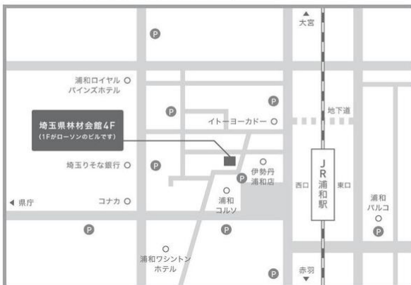
Woods ON (ウッズオン) アクセスマップ